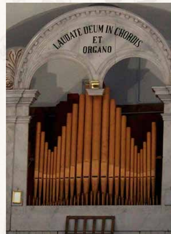
FUSINE Chiesa di San Nicolò Organo attribuito ad Agostino De Marco, ante 1820