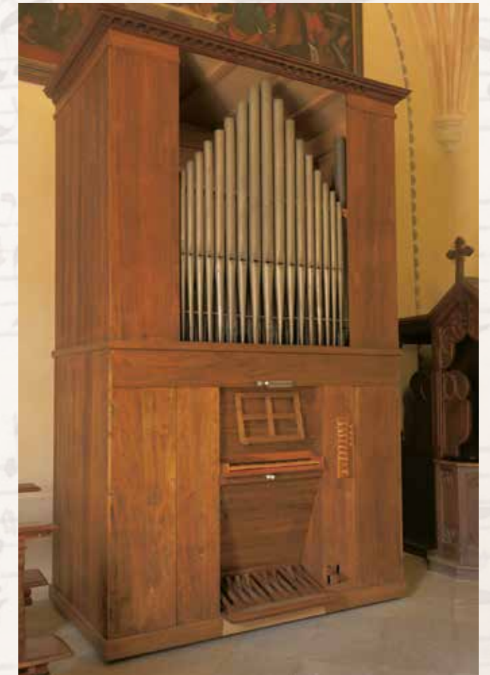
DONT Chiesa di Santa Caterina d'Alessandria Organo di anonimo, circa 1550-1560