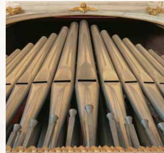
PIEVE Chiesa di San Floriano Organo Gaetano Callido e figli, 1812