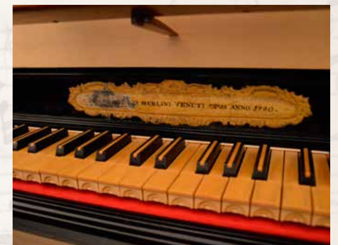
GOIMA Chiesa di San Tiziano Vescovo Organo Francesco Merlini, 1780